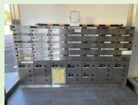
登記・郵便受取可