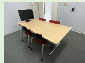
共用会議スペース（無料）

※利用料・初回契約手数料は消費税込みの料金となります。 ※保証金は退去時に原状回復費用を差し引いてお返しいたします。金額は税抜利用料2ヶ月分となります。 ※ご入居にあたっては所定の入居前審査がございます。