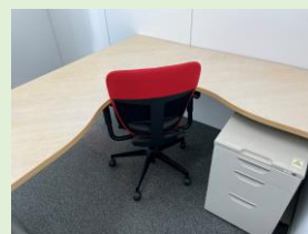
デスク,チェア,キャビネット付き